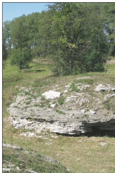
Die berühmten Gipsfelsen im Raum Sulzheim.