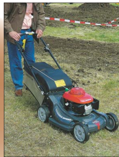
Honda HRX 537 C VYE Profimäher: Bei diesem Rasenmäher kann die Geschwindigkeit mit nur einem Finger stufenlos und präzise gesteuert werden.