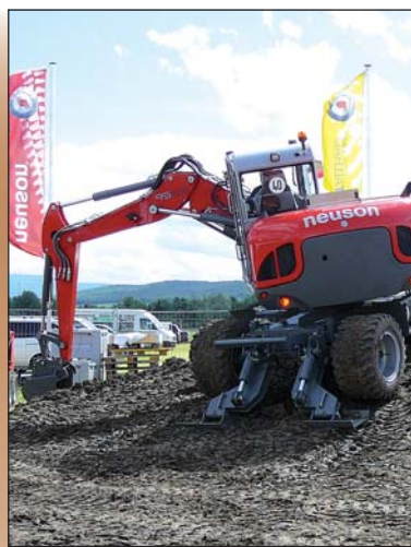
Neuson Mobilbagger 9503: Mit 40 km/h Höchstgeschwindigkeit ist der 9503 Mobilbagger der schnellste seiner Klasse und ermöglicht automotives Fahren.