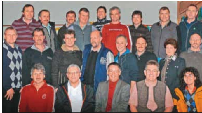
Die Vorstandschaft der bayerischen Maschinen- und Betriebshilfsringe.

Dazu können Landwirte bei den Maschinenringen eine staatlich anerkannte und geförderte Beratung in Anspruch nehmen. Sieben regionale MR-Trainer unterstützen die