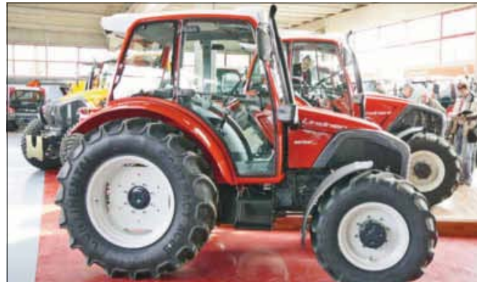
Der Geotrac 74 Alpin ist das Nachfolgemodell des erfolgreichen Geotrac 73.