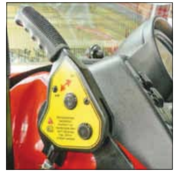
Die zusätzliche Feststellbremse bringt mehr Sicherheit am Hang.

Der Geotrac 74 (78 PS) verfügt serienmäßig ein 16/8-Gang-ZF-Steuer-Vollsynchron-Wendegtriebe. Das Eigengewicht beläuft sich