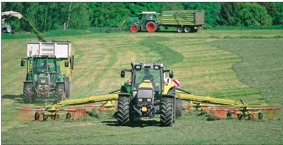
Zusammenarbeit erhöht die Schlagkraft und sichert die Qualität.