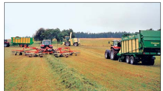
Das WeideFest und die LandTec in Schönbronn bei Rothenburg sind mit ihrem vielfältigen Rahmenprogramm das besondere Sommererlebnis für Rinder- und Pferdehalter sowie für Landtechnikbegeisterte..